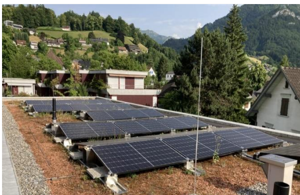
Die Anlage wurde mithilfe von Bürger:innenbeteiligung finanziert.