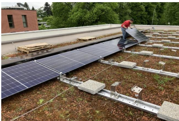
Installation der Anlage.

Tel. +43 (0) 664 342 77 05 , E-Mail: kurator@evang-dornbirn.at