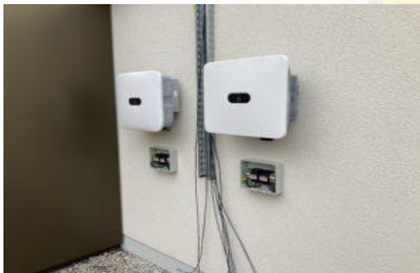
Wechselrichter senden Echtzeitinfos.